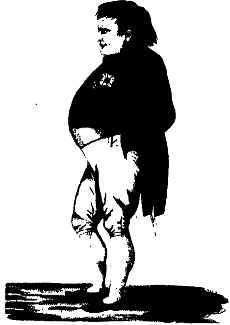
الصور التالية تبين مراحل تطور مرض الامبراطور. نابليون على ظهر الباخرة نورثمبرلاند التي أقلته إلى سانت هيلين أخذت هاتان الصورتان في سانت هيلين، والصورة أخذت قبل شهرين من وفاته.